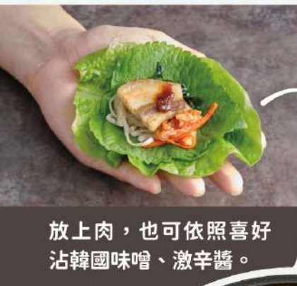
放上肉，也可依照喜好 沾韓國味噌、激辛醬。