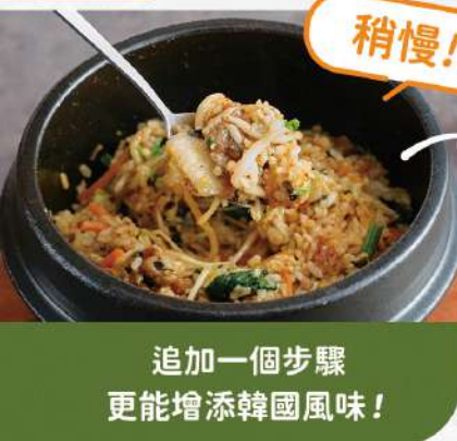
追加一個步驟 更能增添韓國風味！