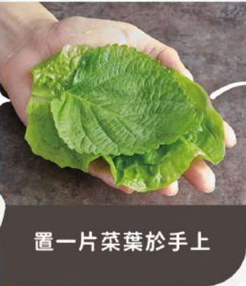
置一片菜葉於手上