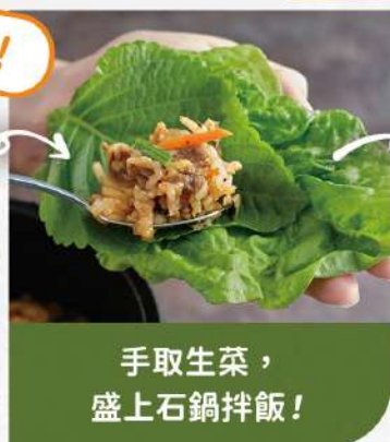
手取生菜， 盛上石鍋拌飯！