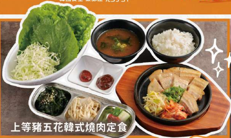
上等豬五花韓式燒肉定食