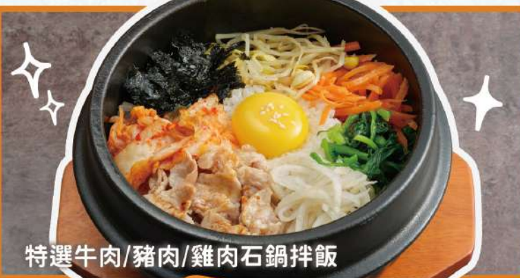
特選牛肉/豬肉/雞肉石鍋拌飯