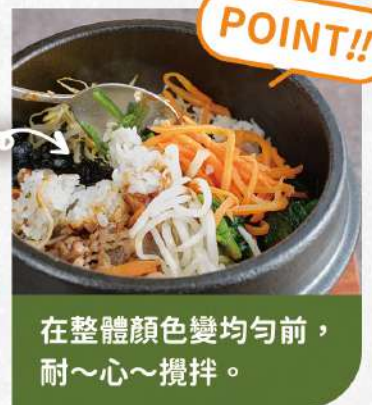
在整體顏色變均勻前， 耐~心~攪拌。