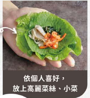
依個人喜好， 放上高麗菜絲、小菜